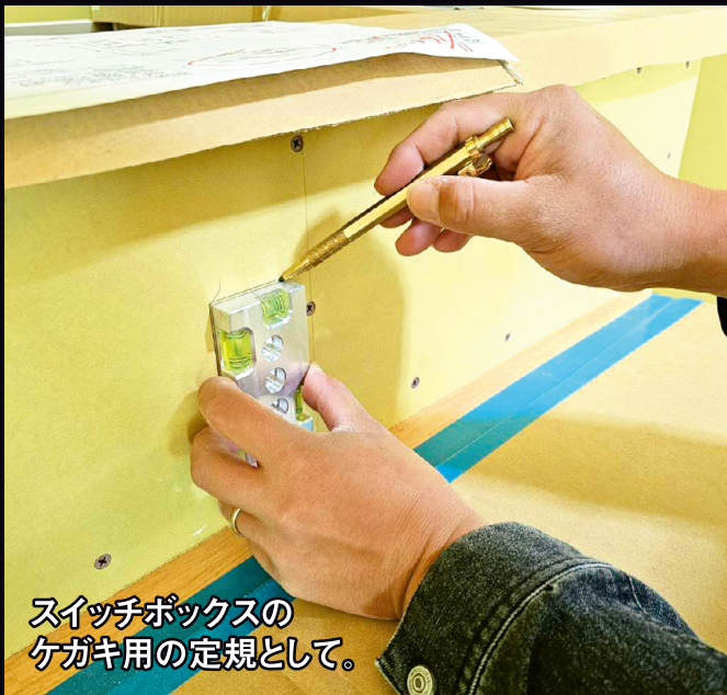
スイッチボックスの ケガキ用の定規として。