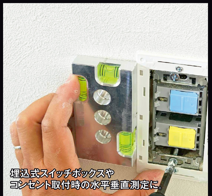
埋込式スイッチボックスや コンセント取付時の水平垂直測定に。