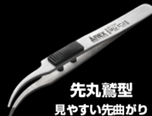
先丸鷲型 見やすい先曲がり