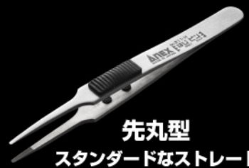
先丸型 スタンダードなストレート