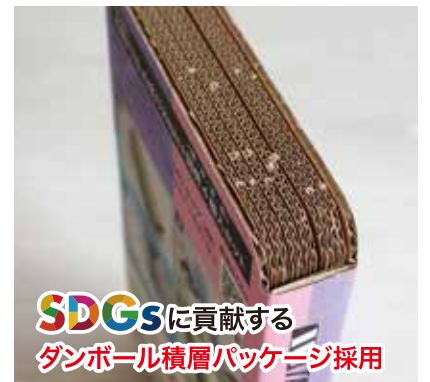
SDGS に貢献する ダンボール積層パッケージ採用