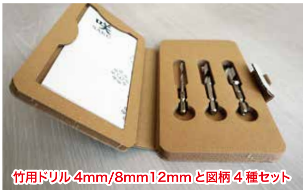
竹用ドリル 4mm/8mm12mm と図柄 4 種セット