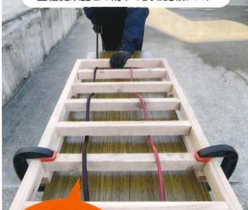
当社従来品との滑りの良さ比較テスト

柱や材料、脚立等、いろんな物の間を縫ってエアホースを這わせるお仕事でホースが何かと引っかかってイライラすることありませんか？ さあ、そんな煩わしさは、しなやかでクセが付きにくく、滑りのいい「超すべるんですエアホース」で解消しましょう！ ソケット分離時の反発や反動をおさえるパージ機能がついた安全性の高いソケットも搭載。 (接続はワンタッチでオートロック機構付です。)