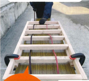
当社従来品との滑りの良さ比較テスト