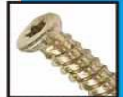
コンクリートビス