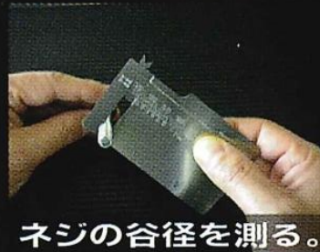
ネジの谷径を測る。