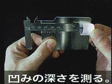
凹みの深さを測る。