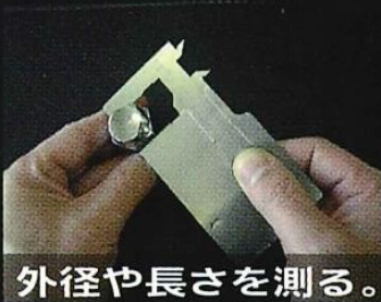
外径や長さを測る。