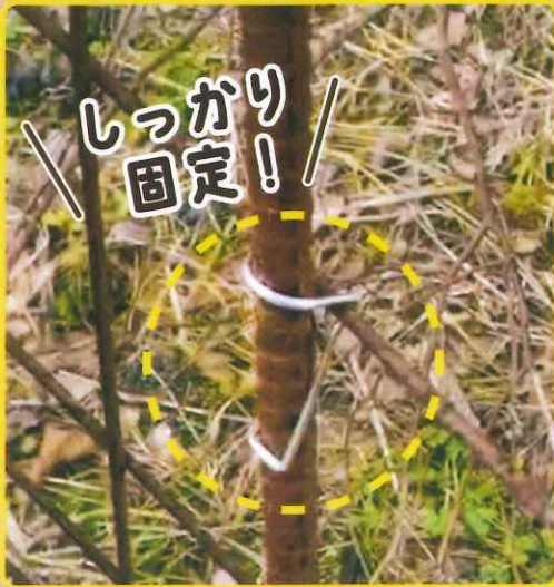
しーしークリップ(通常版)