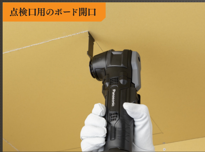
点検口用のボード開口