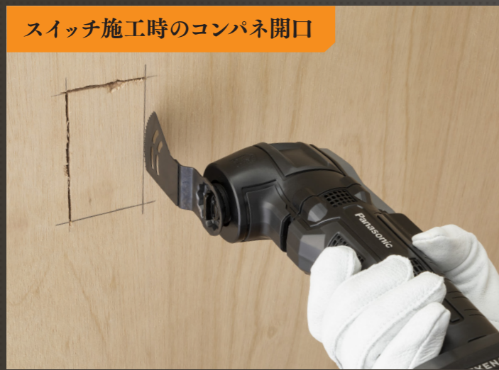
スイッチ施工時のコンパネ開口