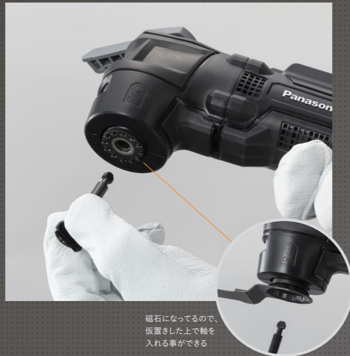
磁石になっているので、仮置きした上で軸を入れる事ができる