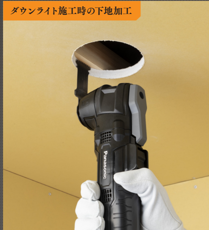
ダウンライト施工時の下地加工