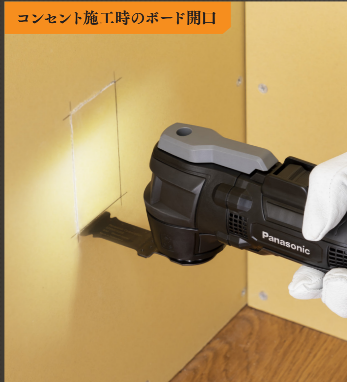
コンセント施工時のボード開口