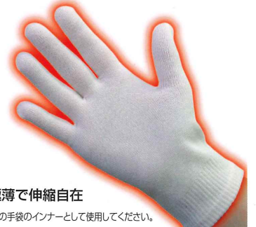
超極薄で伸縮自在 寒い時の手袋の内ナーとして使用してください。

No.TB-70-M / TB-70-L ホカホカインナー手袋 ¥820 Mサイズ 701903 製品重量：約24g(両手) Lサイズ 701927 製品重量：約28g(両手)