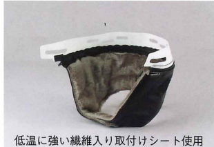
低温に強い繊維入り取り付けシート使用

No.DX-5 クッションパッド付のテラスタイプ ヘッドバンド装着タイプ ¥3,000 104995 製品重量：約95g ※ ヘルメットは別売りです。