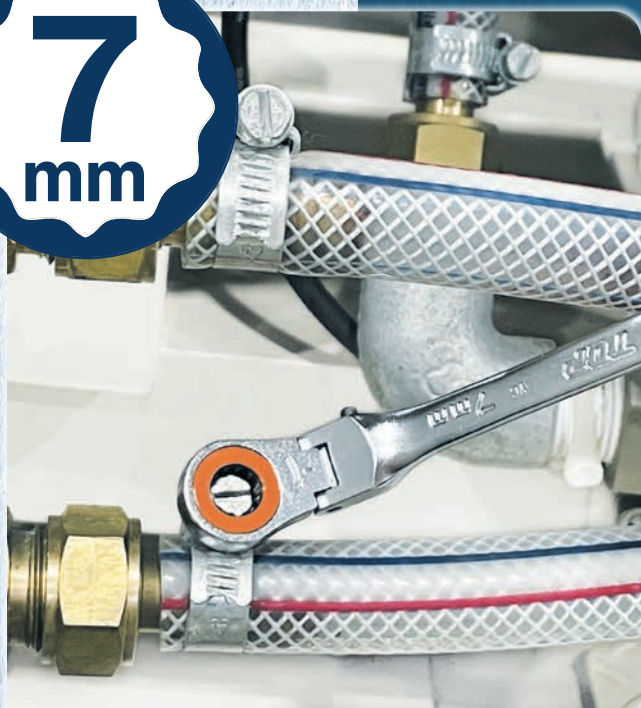
ホースバンドの締め緩めに