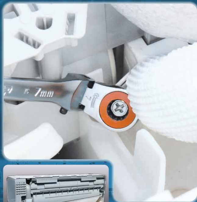
ルームエアコンのドレンホースの着脱に