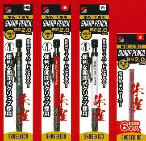
本体 OPP入り 本体 OPP入り 本体 OPP入り 替え芯 OPP入り