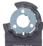
ポッシュスターロック 使用時