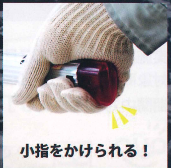
小指をかけられる!