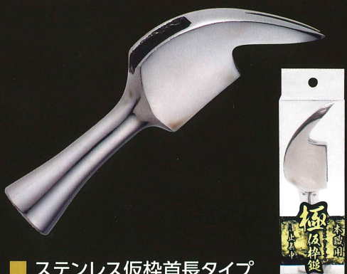
■ ステンレス仮杵首長タイプ