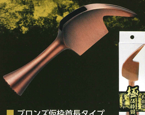
■ ブロンズ仮杵首長タイプ