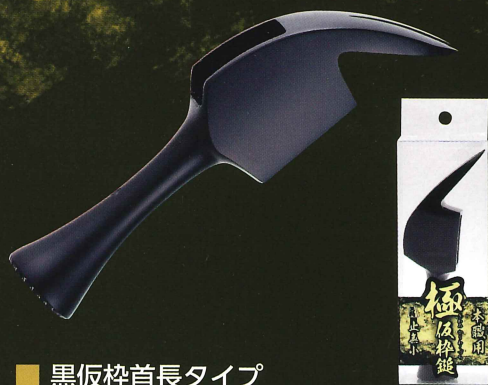
■ 黒仮杵首長タイプ