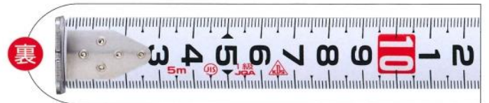
裏面「正縦数字」*メートル目盛のみ