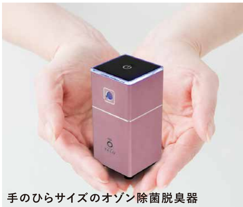
手のひらサイズのオゾン除菌脱臭器