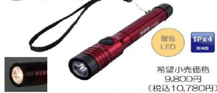
暖色 LED IPx4 防水型 希望小売価格 9,800円 (税込10,780円)