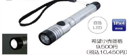
白色 LED IPx4 防水型 希望小売価格 9,500円 (税込10,450円)