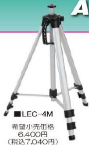
■LEC-4M 希望小売価格 6,400円 (税込7,040円)