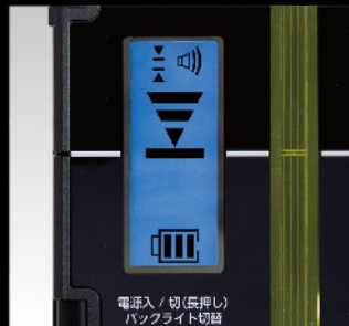
電源入/切(長押し) バックライト切替