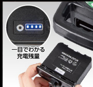
一目でわかる 充電残量