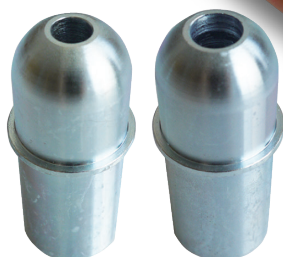
M8用 アダプター (別売) M10用 アダプター (別売)