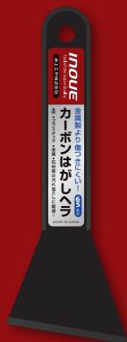
65mm 商品番号 17042 サイズ 65mm / 156mm JAN 4530545009511