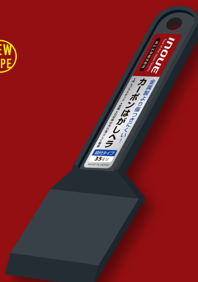
35mm(段付タイプ) 商品番号 17048 サイズ 35mm / 153mm JAN 4530545101208