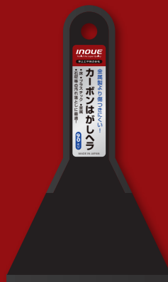
90mm 商品番号 17043 サイズ 90mm / 160mm JAN 4530545005261