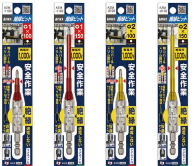
AZM-1100 AZM-1150 AZM-2100 AZM-2150