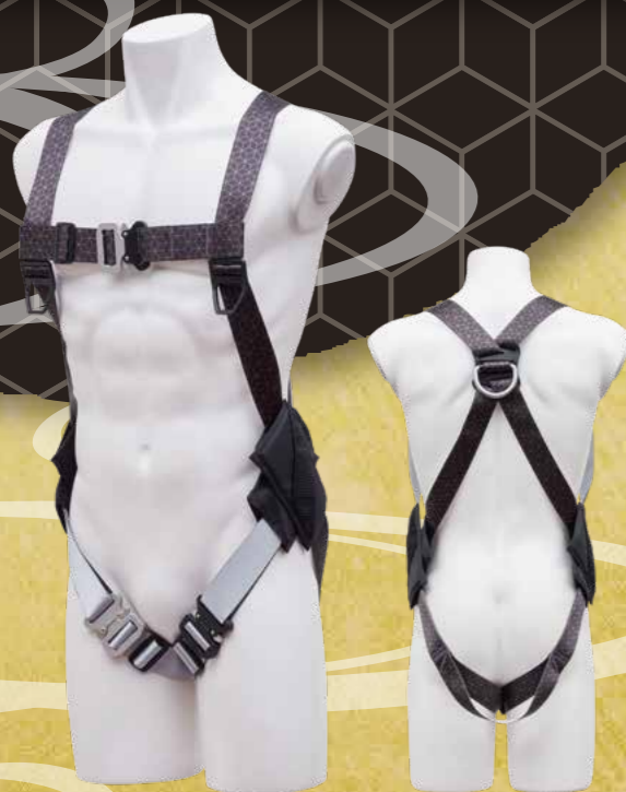
ノングラフルハーネス〈キッコウ〉

日本の伝統文様「亀甲」をイメージ。 亀の甲羅のように固く身を守ること から、長寿や健康を祈願します。