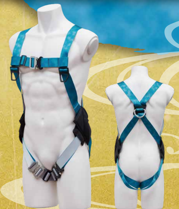
ノングラフルハーネス〈セイテン〉

雲ひとつない青空を透かし模様で表現。爽やかな日本晴れから、希望あふれる未来を祈願します。